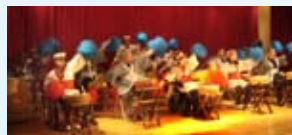
小腦萎縮症病友協會企鵝家族-太鼓樂團

◎ Focus | Witness these patients' courage in fighting against their diseases and live the most of their lives. The concert tries to entice people's attention on the rare diseases and encourages normal people to encounter their frustration fearlessly.