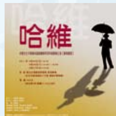
文化大學戲劇學系

◎ 聚焦賞析 | 看不見的，就不存在？愛，足以獲得、擁有；有人看得到，有人看不到；他只是隻兔子，還是我我心目中都存在的那一塊？