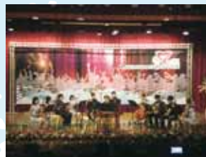
宜蘭大學竹韻國樂社

◎ Focus The lasting music and the abundant love conveyed through it are demonstrated through these traditional instruments and heard by the world. Those never-ending feelings are delivered to everyone through the gentle yet piercing music the musicians play.