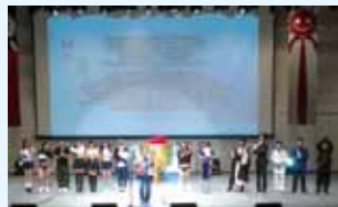
承豪傳播有限公司

這是一部由日本著名搞笑藝人粘土大介 Daisuke Nendo 發起的臺日搞笑演藝交流。粘土大介從上海演藝圈轉往臺灣發展，深深感受臺灣人民對日本的友好，繼第一屆《搞笑奧林匹克 2013》獲得迴響，再次邀請臺灣及日本藝人一起共襄盛舉。