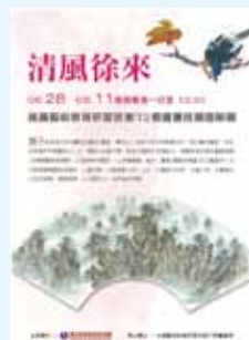
藝教研習 72 期書畫班

扇子的用途可分為實用及藝術 2 層面：實用上，主要作為引風驅暑涼快；用於藝術層面，可見於表演及平面藝術上，如：舞蹈中的扇子舞，戲曲中藉扇子表達動作，相聲表演中是為重要道具（用開扇聲表現氣勢，以搖扇表示閒暇），以及集編織、雕刻、書畫（題扇及扇畫）的工藝創作。