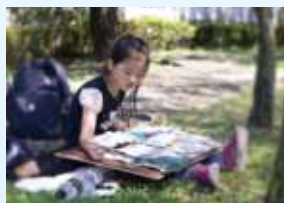
中華現代國畫研究學會

舉凡任何景物，都可以用毛筆、墨、彩色顏料、宣紙等工具描繪出來，並以個人的美感呈現。中華現代國畫研究學會與福臨文化藝術基金會聯合主辦「台灣兒童水墨寫生比賽」，已邁入第 8 年，透過對國畫水墨寫生的觀察描繪體驗，啟發孩子們的創作思想，美化人生。