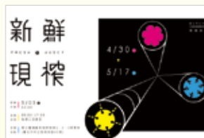
臺北市立大學視覺藝術學系

生活步調不斷加速的現代社會，相對於學習美術的我們，靈感也隨之不斷湧現，並且需要即時釋放！思想或許可以不斷創新，但當下的情感卻無法重新複製或再造。對於不斷湧現的新事物，縱使新鮮，當使其重新轉化為自己內在的創作元素，作品將不再與生活格格不入。