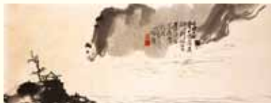
曉雲法師《大海十相》

「清涼藝展」係由華梵大學創辦人曉雲法師創立於民國63年。今年以「海—智慧如海、善法如水」主題，敬檢曉雲導師畫作《大海十相》