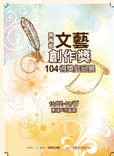
教育部文藝創作獎

「那些用心煉成的詩言詞語，輕輕竄入季節的青草色裡，將平日與夢囈的交談，眼神流轉與心中一顫的情感，切碎、重組，串成自由色的字鍊；晾晒在緋紅牌樓的畫布上。」為鼓勵學校師生（含兼任及退休教師）創作，提供文藝創作交流平臺，期能激發更多動人的文藝作品分享。本獎自民國 70 年起，持續舉辦，為國內歷史最悠久的文藝創作獎項。