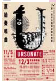
第一屆台灣國際即興音樂節

◎ Focus | This will be the first time the Dutch sound artist visits Taiwan. His perfect ability to recite difficult Dada poetry has lead to frequent invitations to major international arts festivals such as Ars Electronica.