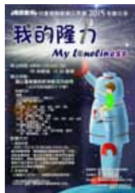
魔鏡魔境兒童戲劇教育工作室

主辦單位 | 國立臺北教育大學幼兒與家庭教育學系 魔鏡魔境兒童戲劇教育工作室 TEL0988-053-973