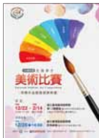
全國學生美術比賽

增進學生美術創作素養，培養國民美術鑑賞能力並落實學校美術教育，特舉辦全國學生美術比賽。共分七大類別，包括：國小組 - 繪畫、書法、平面設計、漫畫、水墨畫、版畫等 6 類；國中組、高中(職)組及大專組 - 西畫、書法、平面設計、漫畫、水墨畫、版畫等 6 類。自國小至大專共計 55 組。