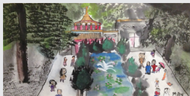
許灝晴 臺中市教大附小 四年級

為提倡固有傳統繪畫藝術，培養兒童對傳統水墨畫的興趣及體認，播下國畫水墨繪畫種子，自 2008 年起，由中華現代國畫研究學會、福臨文化藝術基金會、國立臺灣藝術教育館，共同舉辦台灣兒童水墨寫生比賽活動，已邁入第 9 屆，期能達到兒童教育「五育並重，藝術生活化」之宗旨。