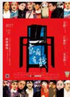
中國文化大學中國戲劇學系

◎ Focus | “The Beijing Opera Gala” gives a fresh interpretation to operas, song and dance shows and newly-invented dramas in from the perspective of modern theatre to display the diverse elements of this performance.