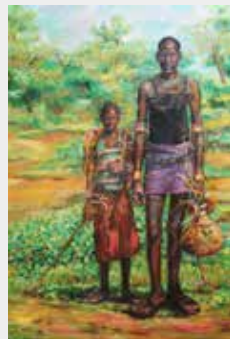
盧月鉛《非洲的父子》

Though Mr. Lu has been painting for more than 50 years, having a solo exhibition that tours north, central and southern Taiwan at the age of 70 marks an important year in his life. In addition to his oil paintings, nearly 1000 coloured eggs with unique modern and abstract images are also on exhibit, created using traditional painting skills from Ukraine; for the purpose of displaying the pure beauty of human bodies, most of his human figure drawings are nude paintings.