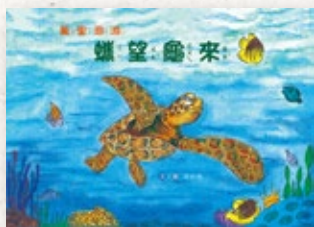
萬里洄游 蠟望龜來 定價$305