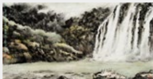
白宗仁《飛瀑入溪流》

以偶然拾得的層次感替代傳統水墨皴擦事先布局，藉由不斷的觀照、反覆沉澱、聯想與想像，再以多年積累的筆墨工夫以及思想深度，或偶然的一種靈光乍現，最終，自然而然導引出一種「華奕照耀，動人無際」的勝境。