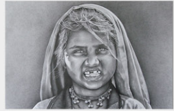
劉如珍《印度小女孩》