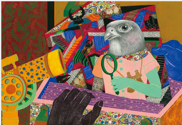
陳佩含 / 自游窩《資料裏找 Bug》