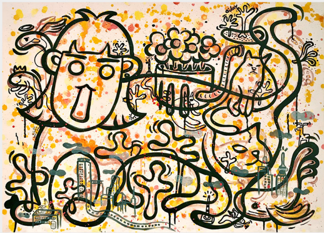
愛倫公主 Ellen 《歡迎來到我房間》