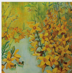
陳梨淑《黃金雨系列 - 串串金》