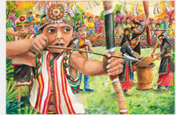
王允濤《歡慶射耳祭》