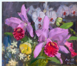
| 黃美賢《蘭花錦簇二》