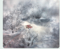
莊畫竹《悠悠歲月天涯醉》