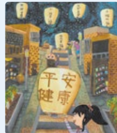
孟善芸 - 11 歲 - 台灣台北 《我的家鄉》