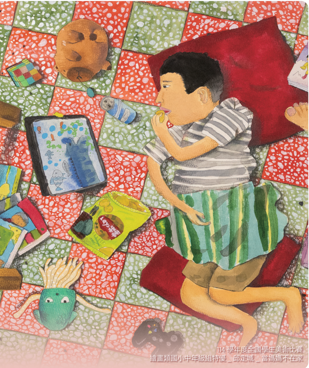
114 學年度全國學生美術比賽 繪畫類國小中年級組特優_邱定城_當媽媽不在家