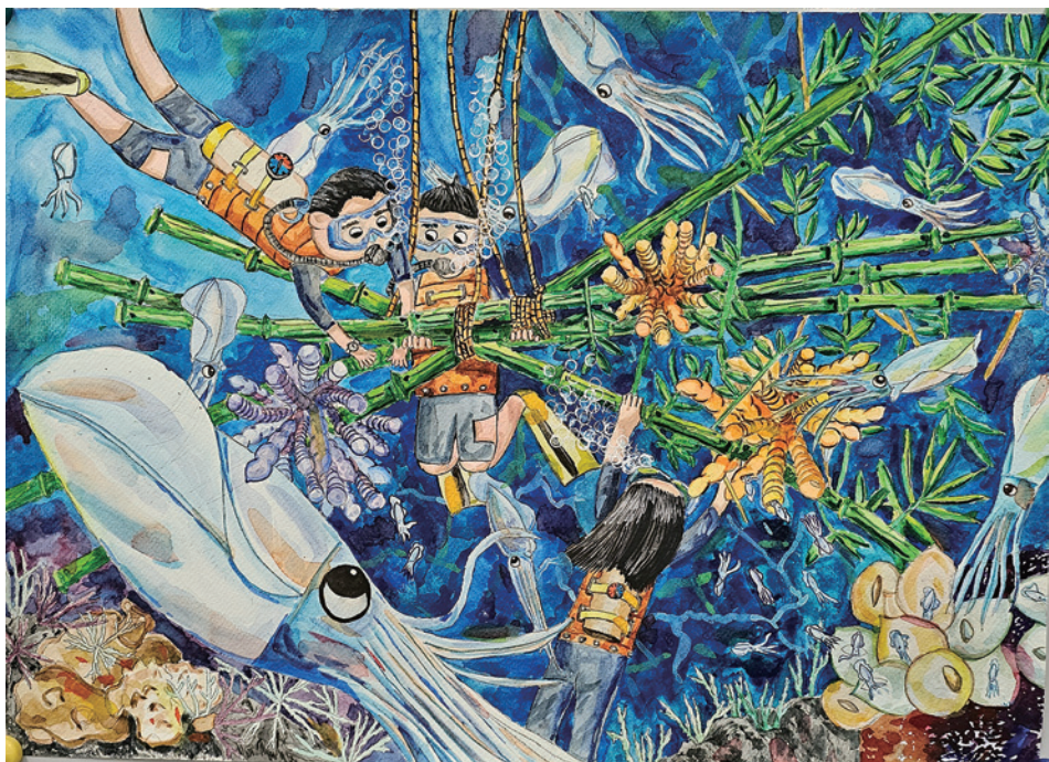
《人海同心·共創軟絲新生命》