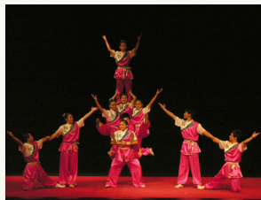
戲曲學院《金玉滿堂》

◎ 聚焦賞析 | 來自戲曲學院的高校生，以八年嚴謹專業的特技訓練，傳承民俗技藝人才，將傳統藝術結合現代創意，展現技藝之力與美，以及豐碩的學習成果。