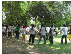
和平高中和喧康輔社