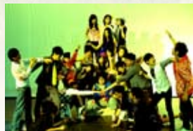
莊敬高職表演藝術科戲劇組