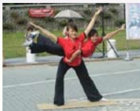
戲曲學院《柔骨雙鳳》

◎ 聚焦賞析 | 由參與2009臺北聽障奧運開幕之新生代演員擔任，以傳承傳統技藝的表演，展現傳統技藝新風貌，驚險的特技秀，帶給觀眾獨一無二的近距離感官體驗。