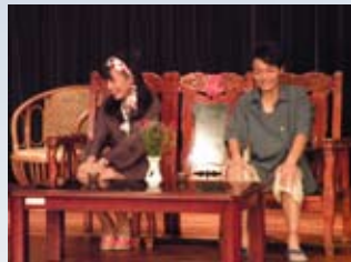
新民高中表演藝術科

◎ 聚焦賞析 | 一齣臺灣戲與臺灣囡仔的故事：返頭一看50冬，老臺灣好像在前幾天，囡仔吃冰追火車，懷念的滋味攏在這……。臺灣戲遇上臺灣歌，阮將音樂和戲劇作伙扮。