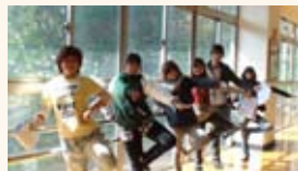
龍華科大應用外語學系