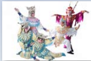
戲曲學院京劇學系

從三國時代的《古城會》與《小宴》，到宋朝的包公《銅判官》；從庶民生活的《賣水》，到民間傳奇白蛇傳中的《盜仙草》與《金山寺》；有教忠教孝的《岳母刺字》，亦有血戰沙場的《殺四門》，三場演出貫穿古今，充分體現中華文化與傳統戲曲之美。