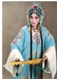
臺灣崑劇團〈牡丹亭·遊園〉

◎ 聚焦賞析 | 臺灣崑劇團特別聘請兩岸三地重要崑劇演員來臺教學，培養出優秀學員，並透過學員現身說法，引領民眾體驗崑劇藝術之美。