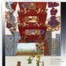
滬江高中《花博海報》

◎ 聚焦賞析 | 一份對人與環境的關注與心意，歡迎您的悉心品味，更期待您的熱情呼應！