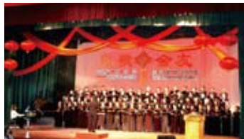
宇宙光台北愛心合唱團

匯集福州大學晚霞合唱團、美國神州合唱團、宇宙光台北愛心合唱團，兩岸三地合唱團，以各自選曲演唱及3團大合唱方式演出。精彩曲目包括：聖樂歌曲、民族歌謠、流行歌曲、黑人靈歌、百老匯選曲等，以中、英、拉丁、義大利等語言演唱，充分展現合唱音樂盛會。並特邀大家的好朋友孫越先生客串演出。