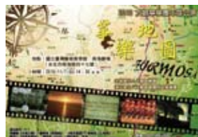
大觀國樂團附設箏樂團

「箏樂地圖」以臺灣為首站出發，由南到北網羅臺灣著名的作曲家，從他們筆下揮灑的音符刻畫出臺灣美麗的景象，以及在地的人文氣息。演出曲目：《古城之憶》《思想起》《桃花過渡》《土地歌》《阿美族舞曲》《水仙》《那山》《月，虫，子》。