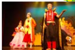
啟英高中《愛麗絲仙境夢遊》

The content and stylistic arrangement of children's play "Alice in Wonderland" are suitable for the whole family to watch. We encourage parents to improve their mutual relationship with children by joining in the artistic performance together. We also hope that, through this opportunity, children can develop their imagination. It is suggested that children who come to see this show be over 6 years old.