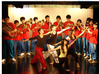
南強工商 電影電視科

The singing and dancing in the “Street Art Shows” is a melody of dancing for the beauty in life. Everyone has arts feeling, and in the afternoon time of holidays, you are heartily invited to come. A group of enthusiastic students in high school, who love performance arts, display art talents in music, dramas, and dances. Through a section of singing and dancing performance actions, vitality with talents of their creations and art skills is developed, guides everyone into the theatre together to enjoy the fascination of the theatre.