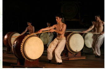
景文高中 優人表演藝術班

《暴風地帶》是生命之歌，運用多種藝術形式來呈現，訴說生命從誕生，歷經重重挑戰，到喜悅再生的故事。景文高中優人表演藝術班，結合音樂、舞蹈、武術與擊鼓以靜坐和探索生命內涵來闡揚藝術，以初生之犢的勇氣和熱情，透過木琴、鋼琴、西洋鼓、大鼓、神聖舞蹈、武術，呈現一幕震撼人心的場景，時時刻刻緊扣你的呼吸和心跳表達情感與生命力，歡迎各界蒞臨指導。